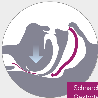
Schnarchen Gestörter Luftstrom

fünf- bis zehnmal in der Stunde auf, ist dies ein Hinweis auf eine behandlungswürdige Schlafapnoe. Der Begriff kommt aus dem Griechischen und bedeutet wörtlich übersetzt „Schlaf ohne Luft“