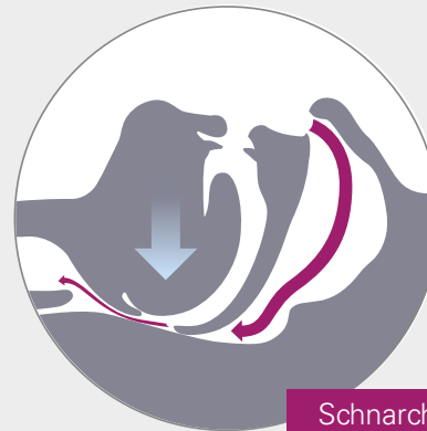
Schnarchen Gestörter Luftstrom